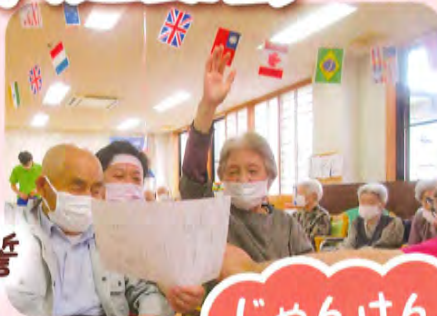
じゃんけん リレー